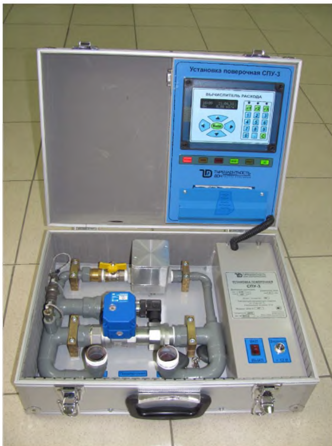
Рисунок 1- Общий вид установки поверочной СПУ-3

На рисунках 2 и 3 приведены схемы пломбировки и обозначение мест для нанесения пломб и наклеек в целях предотвращения несанкционированной настройки и вмешательства.