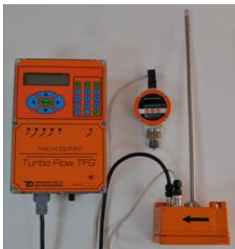
Turbo Flow TFG-S с 1 ППП

На фото 1 приведен общий вид расходомера.