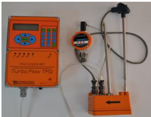
Turbo Flow TFG-H