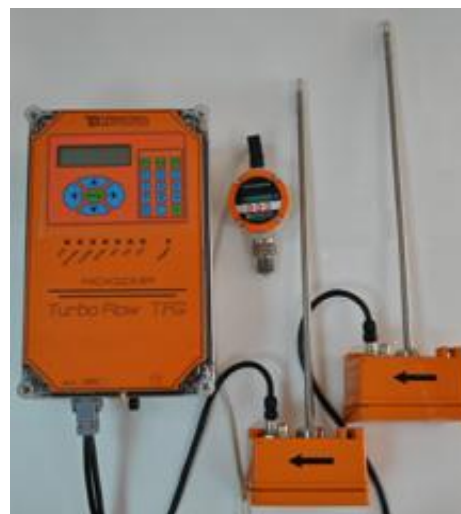
Turbo Flow TFG-S с 2 ППП