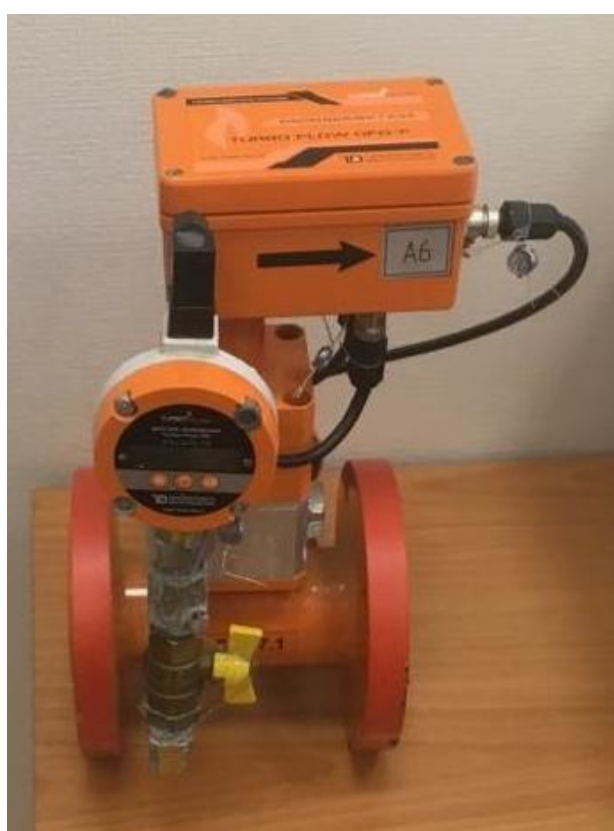
а) Расходомер Turbo Flow GFG-F

Общий вид расходомера представлен на рисунке 1.