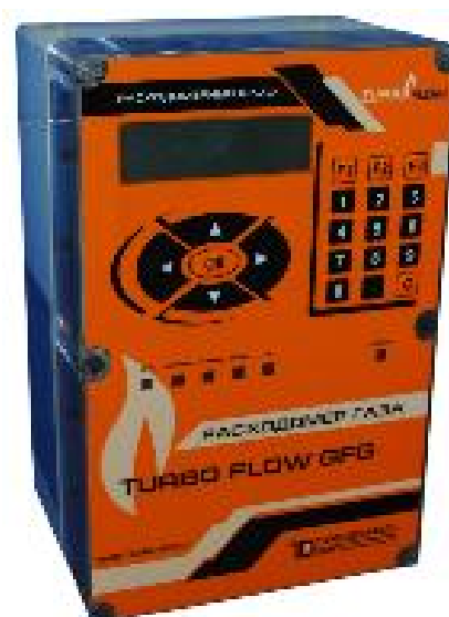
б) Внешний терминал расходомера Turbo Flow GFG-F