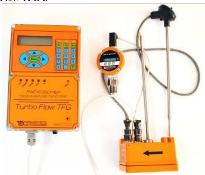
Turbo Flow TFG-H