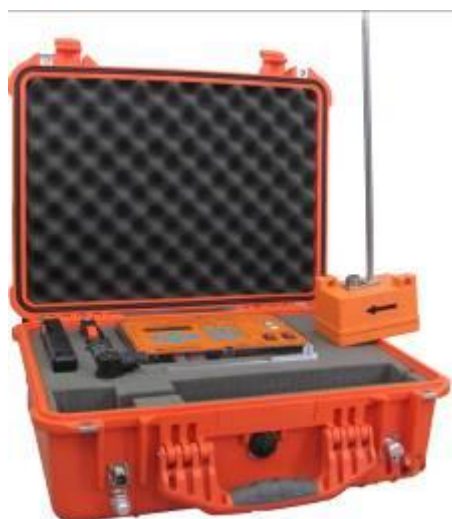
Turbo Flow TFG в переносном кейсе