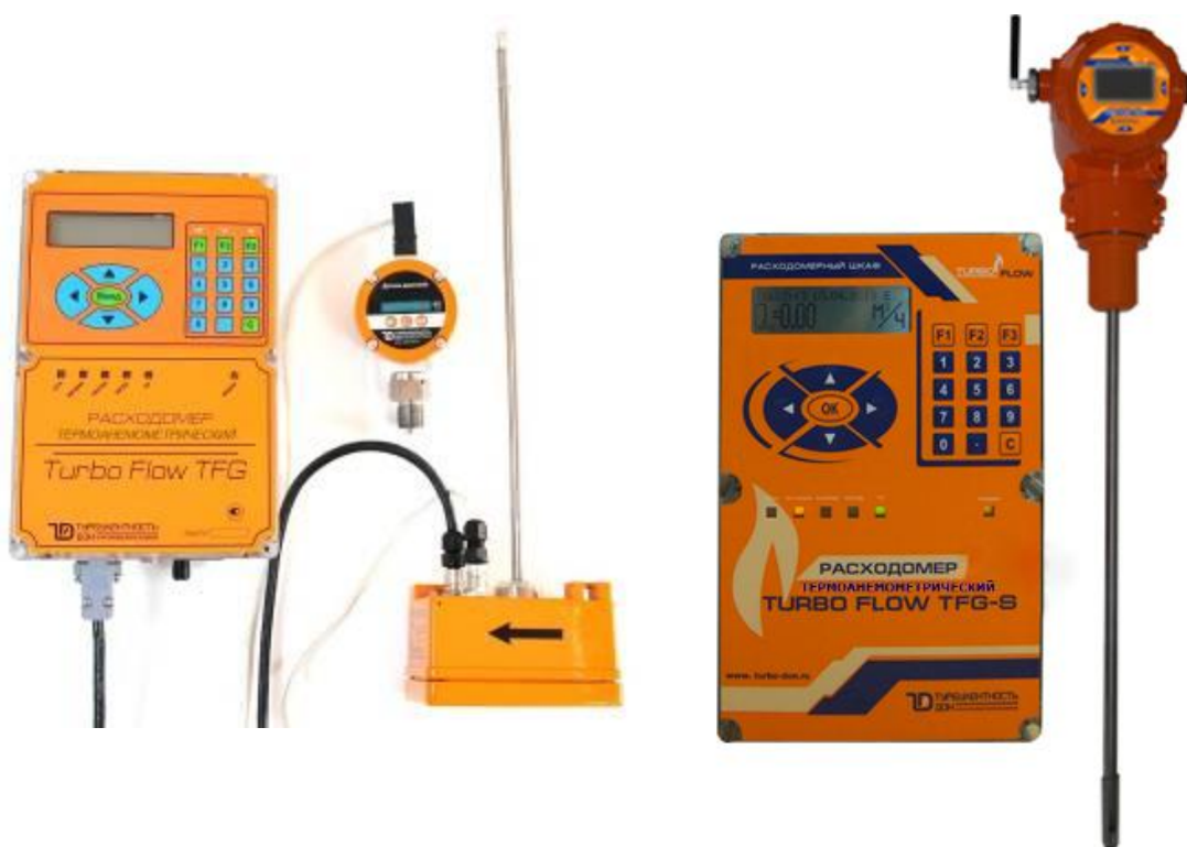
Turbo Flow TFG-S